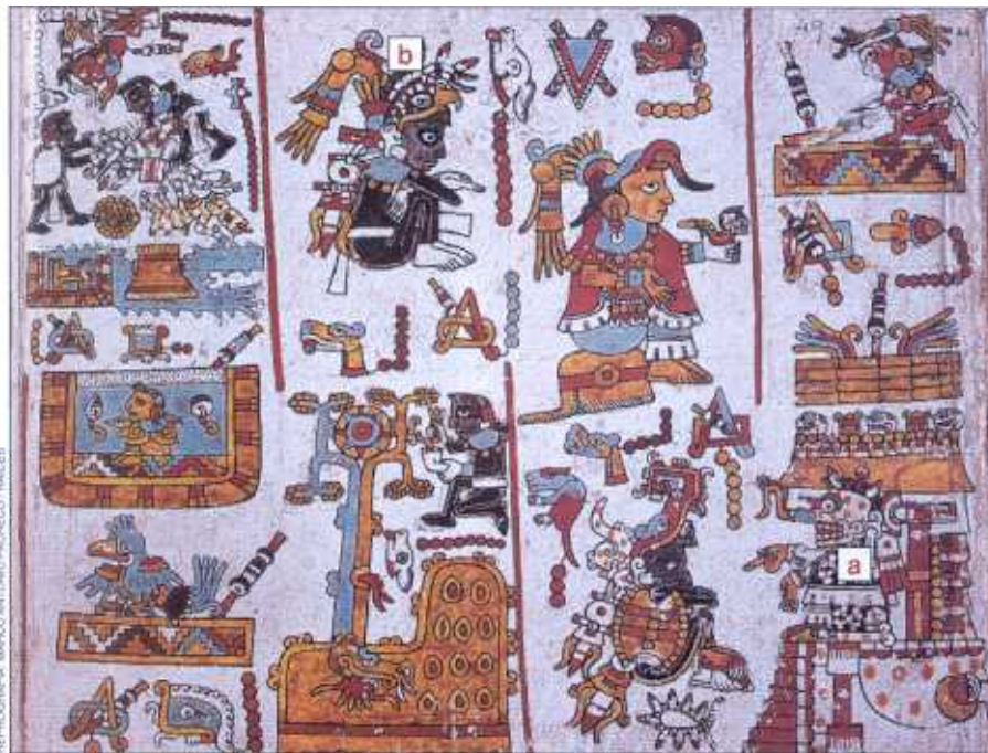
En Chalcatongo –Mixteca Alta–, en el Templo de la Muerte, santuario de la diosa 9 Hierba, Cráneo (a), 8 Venado, Garra de Jaguar (b) recibió los emblemas utilizados en la fundación de reinos. Códice Nuttall , lám. 44.

A principios de 1522, sólo unos cuantos meses después de la conquista de la capital azteca de Tenochtitlan, Hernán Cortés envió un ejército comandado por Pedro de Alvarado hacia la ciudad mixteca de Tututepec (Yucu Dzaa en mixteco), situada en el pie de monte que da a la planicie costera de Oaxaca. Desde la fundación de la ciudad, a finales del siglo XI por el legendario gobernante 8 Venado, Garra de Jaguar, Tututepec fue la capital política de uno de los señoríos más poderosos de México. Documentos coloniales antiguos