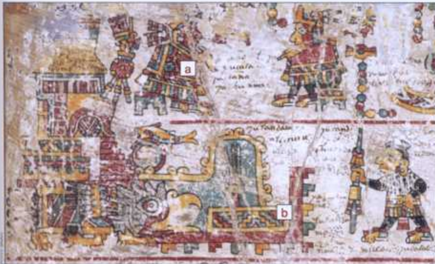
En el Bajo Río Verde, 8 Venado, Garra de Jaguar (a) fundó el reino de Tututepec (b). En el Posclásico Temprano (1100 d.C.), esa región estaba densamente poblada por emigrantes de la Mixteca Alta. Códice Colombino-Becker, lám. 5.

Clásico Tardío (500-800 d.C.) llegó a ser la capital de uno de los señoríos más poderosos de Oaxaca. Río Viejo albergaba impresionantes estructuras monumentales y en imponentes monolitos de granito se grabaron de manera experta imágenes de la dinastía reinante. Como muchos otros centros urbanos mesoamericanos, Río Viejo decayó al final del Clásico. El Posclásico Temprano fue un tiempo de fragmentación política, de deterioro de las poderosas instituciones de gobierno, y de guerras. Así, el periodo precedente al auge del imperio de Tututepec se caracterizó por la inestabilidad política y los conflictos.