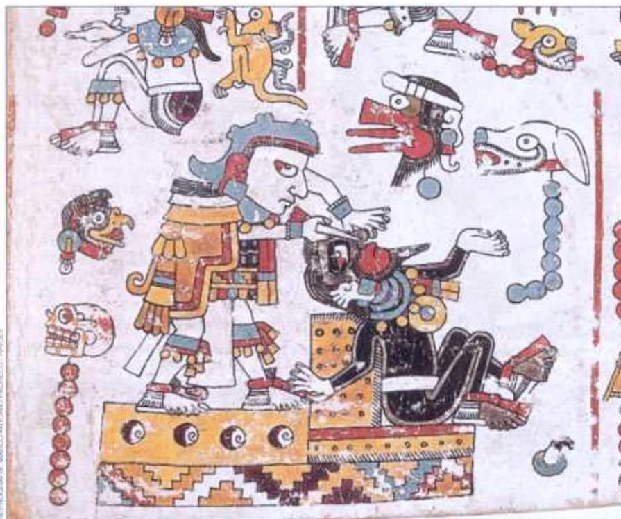
8 Venado, Garra de Jaguar aseguró el flujo de mercancías del Bajo Río Verde al Centro de México mediante un rito de perforación nasal. Ese ritual lo convirtió en tecuhtli , señor, miembro del linaje real tolteca-chichimeca. Códice Nuttall , lám. 52.

tomar ventaja de la diversidad ecológica de un corredor que iba desde la costa hasta los altos. La región de Río Verde inferior se caracterizó por una gran productividad agrícola, así como por una diversidad de recursos provenientes de las tierras bajas, los cuales eran valiosos para las poblaciones de las regiones altas, entre los que se encontraban cacao, sal, plumas de quetzal, algodón y pescado. Al tomar control de los recursos costeros, 8 Venado pudo así haber representado una alianza atractiva para los nobles de las regiones altas. El acceso a recursos costeros pudo haber sido un factor en la alianza entre el señor 8 Venado y un señorío poderoso de la región de los altos, que contribuyó al éxito del primero para fundar Tututepec y derrotar a los competidores locales.