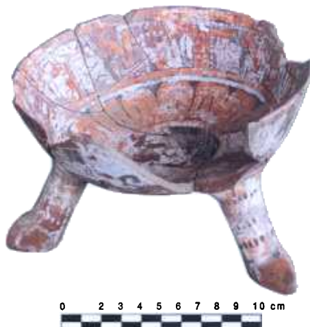
Vasija de cerámica policroma estilo Mixteca-Puebla. En Tututepec, esta cerámica, usada principalmente en rituales, transmitió —mediante temas de guerra, sacrificio y pacto con los dioses— conceptos religiosos e ideológicos de Estado.

Entre los objetos de las dos residencias había algunos bienes suntuarios, como ce-